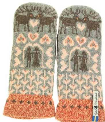
4 lager Fästfolk Emilia Einar