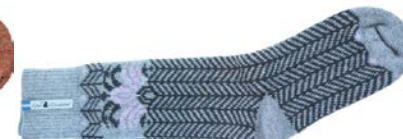
Ylle socka Fager Ingvor