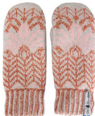
4 lager Fager Ingun

Art#ÖING11TVMI Art#ÖING11TVLA Art#ÖING11TVRE