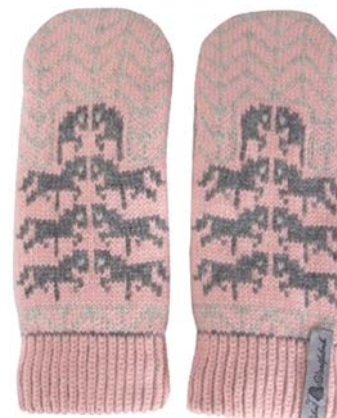
4 lager Gotland rosa