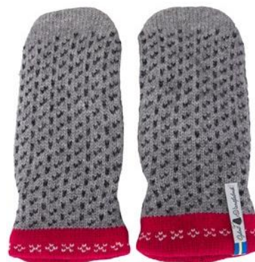
4 lager Skaftö grå