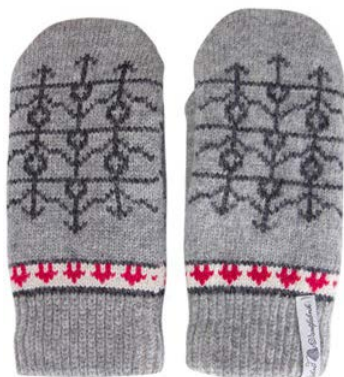
4 lager Ekshärad grå Art#ÖEKS05TVMI Art#ÖEKS05TVLA Art#ÖEKS05TVRE