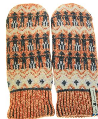
4 lager Kören Kristina

- Art#ÖKER05TVMI Art#ÖKER05TVLA Art#ÖKER05TVRE