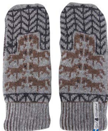
4 lager Gotland grå