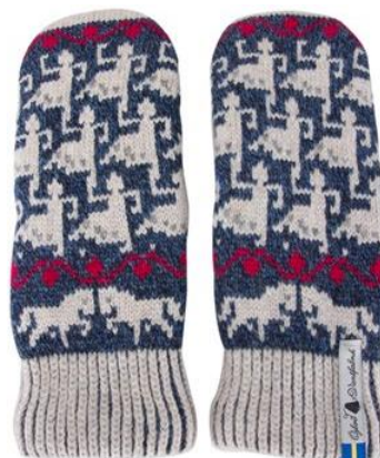
4 lager Ringdans Ester Art#ÖEST40TVLA