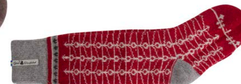
Ylle socka Ekshärad röd Art#ÖEKS60SOMI 34-37 Art#ÖEKS60SOLA 38-41 Art#ÖEKS60SORE 42-45