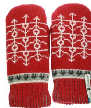
4 lager Ekshärad röd Art#ÖEKS60TVLA Art#ÖEKS60TVRE