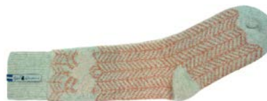
Ylle socka Fager Inez