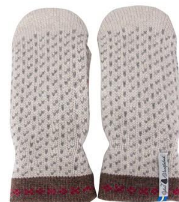
4 lager Skaftö snö

Art#ÖSKA11TVMI Art#ÖSKA11TVLA Art#ÖSKA11TVRE