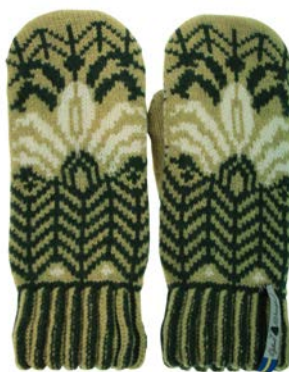
4 lager Fager Inez