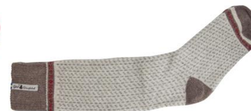
Ylle socka Skaftö snö

Art#SKA05SOMI 34-37 Art#ÖSKA05SOLA 38-41 Art#ÖSKA05SORE 42-45