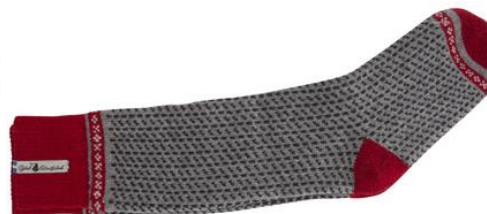
Ylle socka Skaftö grå

Art#ÖSKA02SOMI 34-37 Art#ÖSKA02SOLA 38-41 Art#ÖSKA02SORE 42-45