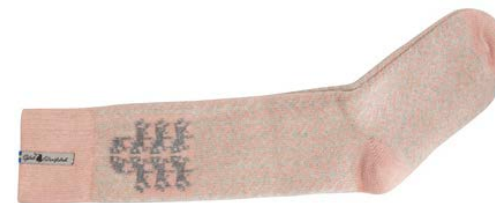
Ylle socka Gotland rosa

Art#ÖGOT11SOMI 34-37 Art#ÖGOT11SOLA 38-41 Art#ÖGOT11SORE 42-45