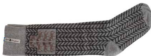
Ylle socka Gotland grå

Art#ÖGOT05SOMI 34-37 Art#ÖGOT05SOLA 38-41 Art#ÖGOT05SORE 42-45