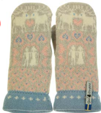
4 lager Fästfolk Elsie Erik