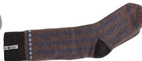
Ylle socka Ekshärad brun Art#ÖEKS30SOLA 38-41 Art#ÖEKS30SORE 42-45