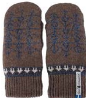
4 lager Ekshärad brun Art#ÖEKS30TVLA