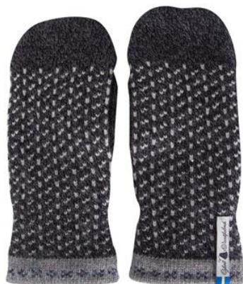
4 lager Skaftö Sot