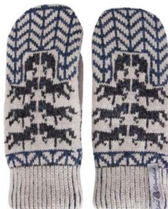
4 lager Gotland kalk