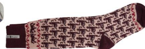
Ylle socka Ringdans Ebba Art#ÖEBB61SOMI 34-37 Art#ÖEBB61SOLA 38-41