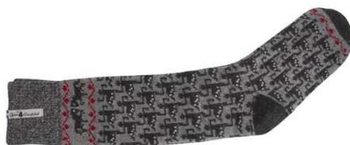
Ylle socka Ringdans Elin Art#ÖELI05SOMI 34-37 Art#ÖELI05SOLA 38-41 Art#ÖELI05SORE 42-45