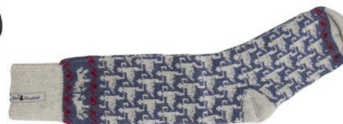
Ylle socka Ringdans Ester Art#ÖEST40SOMI 34-37 Art#ÖEST40SOLA 38-41 Art#ÖEST40SORE 42-45