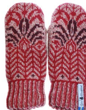
4 lager Fager Ingvor

Art#ÖING11TVMI Art#ÖING11TVLA Art#ÖING11TVRE