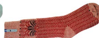
Ylle socka Fager Ingun