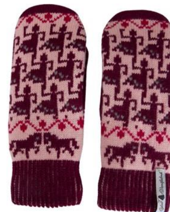
4 lager Ringdans Ebba Art#ÖEBB61TVLA