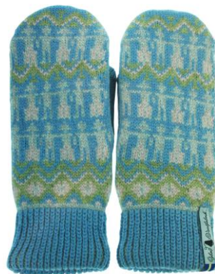
4 lager Kören Karin