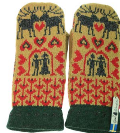
4 lager Fästfolk Evelina Ewald