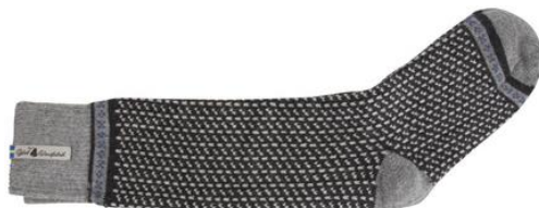
Ylle socka Skaftö sot

Art#ÖSKA02SOMI 34-37 Art#ÖSKA02SOLA 38-41 Art#ÖSKA02SORE 42-45