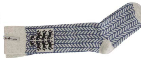
Ylle socka Gotland kalk

Art#ÖGOT05SOMI 34-37 Art#ÖGOT05SOLA 38-41 Art#ÖGOT05SORE 42-45