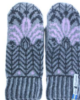
4 lager Fager Iris