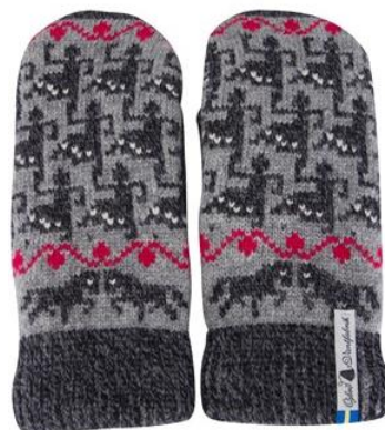
4 lager Ringdans Elin Art#ÖELI05TVLA Art#ÖELI05TVRE