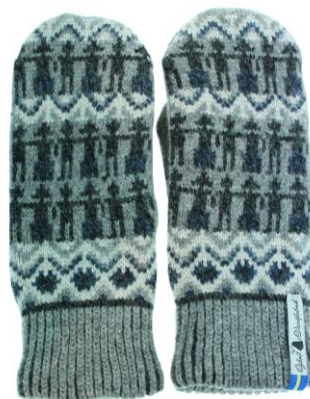
4 lager Kören Kerstin

- Art#ÖKER05TVMI Art#ÖKER05TVLA Art#ÖKER05TVRE